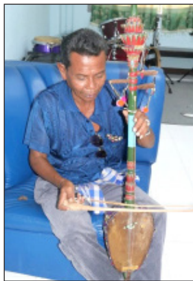
ภาพที่ 7 วิธีการจับคันทวนซึก

ผู้บรรเลงจับคันทวน หรือตุแลบาแก ด้วยมือซ้ายในลักษณะกำมือคันทวนอยู่ระหว่างนิ้วหัวแม่มือ และนิ้วชี้ โดยจับคันทวนตำแหน่งบริเวณเชือกรัดอก แขนปล่อยตามสบายไม่ปรากฏลักษณะเกร็งแขน