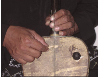
ภาพที่ 3 ชูชู