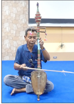
ภาพที่ 6 วิธีการจับคันทวน