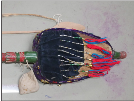
ภาพที่ 2 ป้าแปบุง หรือกะโหลกซอ

ป้าแปบุง หรือกะโหลกซอ ทำจากไม้รูปทรงสามเหลี่ยม ปลายเหลี่ยม มีลักษณะমনคล้ายกะโหลกซอสามสาย หากแต่กะโหลกหรือบะทำจากไม้โดยใช้วิธี ขุดให้เป็นโพรง ทำหน้าที่เป็นกล่องเสียง ด้านข้างกะโหลกต่อไปจนด้านหลังหุ้มด้วย ผ้ากำมะหยี่สีม่วง และสีดำ ร้อยด้วยสายลูกปัด และไหมพรม