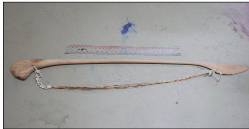
ภาพที่ 4 ปาแตแกลแซ หรือ คันซัค